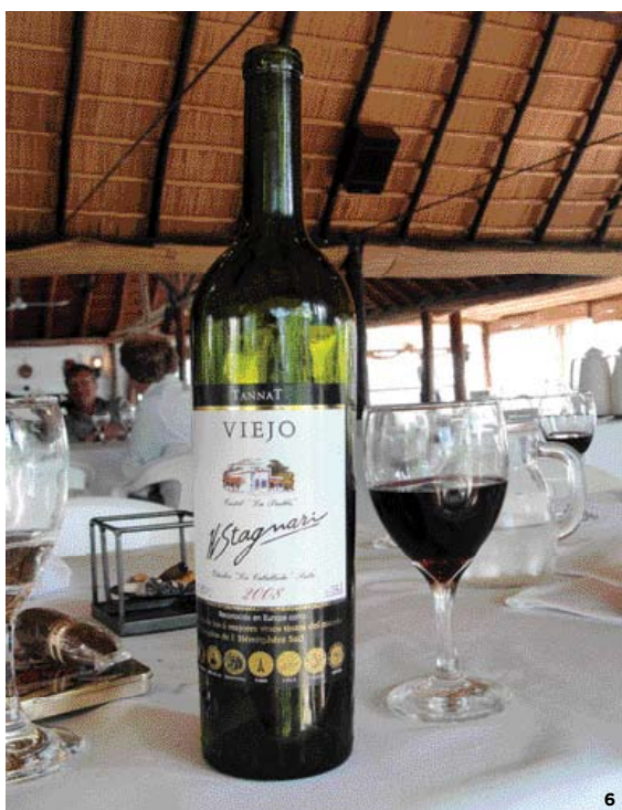
EN ESTA PÁGINA 5 Caminata obligada por Plaza de la Independencia. 6 Tannat Viejo, de los vinos más premiados de Uruguay.

ya que entre sus callecitas hay muchos restaurantes, bares y un centro comercial que es de los más concurridos. Mi favorito sin embargo fue el barrio de la Ciudad Vieja, que encierra el casco antiguo de la ciudad, el cual hasta 1829 estuvo protegido por una gran muralla. Sus calles albergan edificios coloniales y calles peatonales; y en el límite con el Centro, está la Plaza Independencia, rodeada de árboles de plátano y de edificios de distintas épocas, en cuyo zócalo se encuentra un mausoleo con los restos de José Artigas, a quien los uruguayos reconocen como “fundador de nuestra nacionalidad”. En esa plaza, nace la avenida 18 de Julio, la más importante y grande de la ciudad.